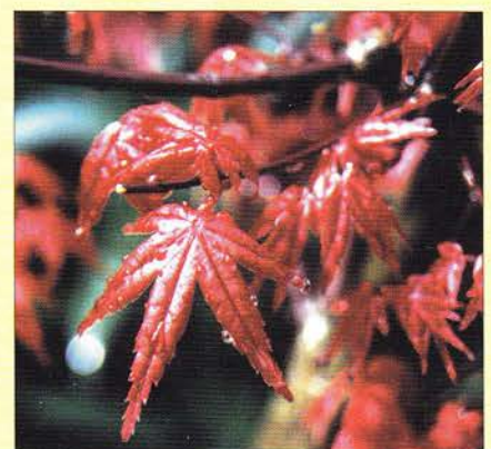
Esdoorn ( Acer palmatum Deshojo ).