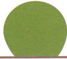
Zgn. 'Europese bol'.