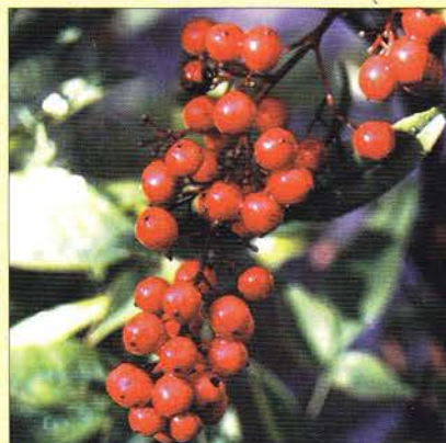
Bessen van Nandina.

Kunnen we het hele jaar snoeien in onze Japanse tuin, bemesten doen we meestal uitsluitend aan het begin van het groeiseizoen. In een Japanse tuin met mos moet goed worden opgepast met bemesting, want mos kan er in het geheel niet tegen. De betreffende stukken overslaan. Zelf ben ik een groot voorstander van organische mest, zoals compost en wormenmest, die de meeste planten