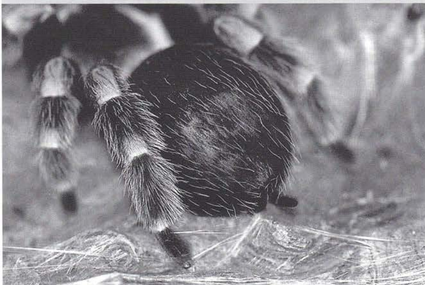
Spintepels in actie