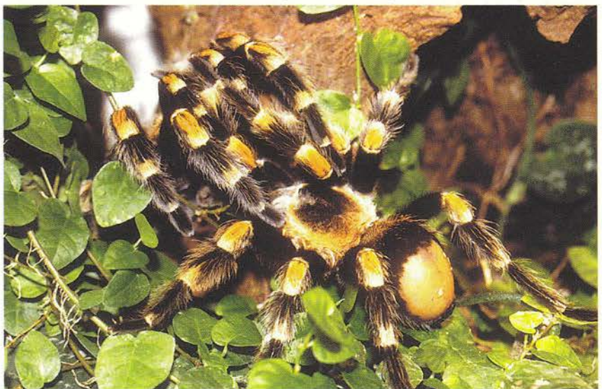
Toenadering voor de paring

Er zijn vele soorten vogelspinnen. Hun grootte varieert van net iets meer dan een centimeter tot ongeveer dertig centimeter. In gevangenschap kunnen sommige soorten wel vijftig jaar oud worden. In de natuur worden ze zeker niet zo oud, want vele dieren hebben