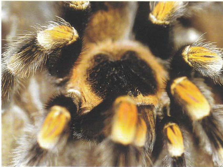
Oog in (acht) ogen met de Roodknievogelspin

Toen Maria Sibylla Meriam in 1705 haar beroemde boek 'Metamorphosis insectorum surinamensium' schreef, had zij, noch iemand anders kunnen denken, dat het dier, dat zij beschreef als 'diergelijke groote swarte spinnen' ofwel het fenomeen vogelspin, het onderwerp van een over de gehele aardbol populaire terrariumhobby zou worden.